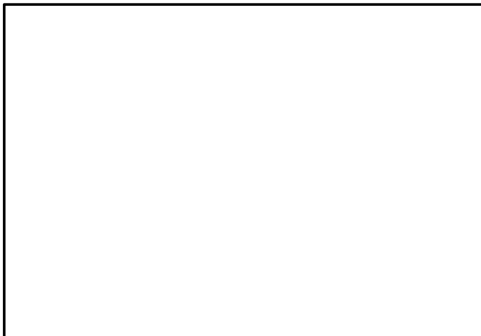
Obr. 2. Názov

Krížové odkazy sa vkladajú podobne ako pre rovnice, len v ponuke vložiť odkaz na: Iba menovka a číslo. Potom vidíme, že na Obr. 2 je obdĺžnik.